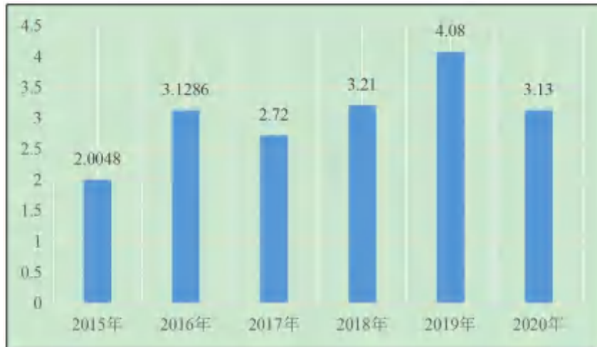
图 1-5 2015-2020 年阳泉市邮政业务总量 (亿元)

传统物流转型步伐明显加快。 连锁经营、物流配送、电子商务等新型流通方式不断拓展，形成了供应商直接配送、连锁企业自营配送、社会化配送及共同配送等物流配送模式。截至 2020 年底，全市共有电子商务产业园 4 家，网络零售企业 20 家，电子商务平台企业 8 家，电子商务服务企业 25 家，县级电子商务运营中心 1 个，网店 1050 家，产品涉及耐火材料、特色农产品等。国际陆港公司云平台商务结算系统顺利上线运行。通宝鑫能物流、顺康商贸等第三方物流企业不断涌现，商贸物流网络加快向农村乡镇下沉，向居民社区拓展，服务能力不断增强。