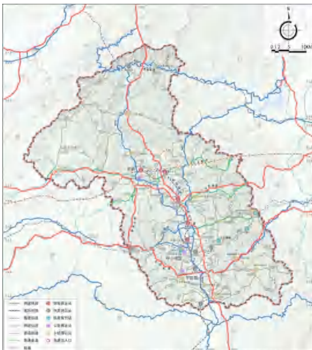
图 1-1 阳泉市综合交通体系现状

航空： 市区距太原、石家庄机场各约 100 公里，初步谋划建设阳泉支线机场，开展航空运输。