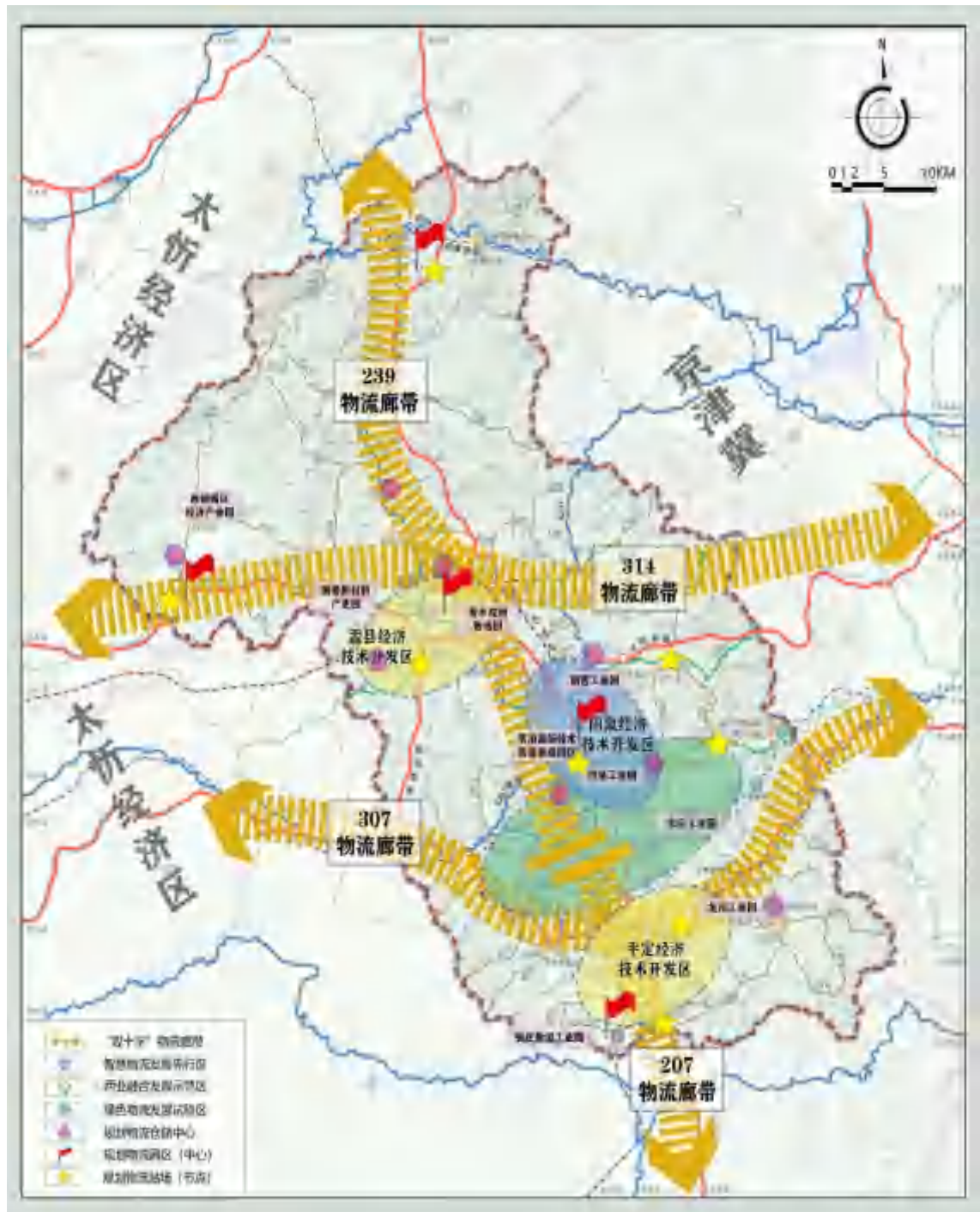
图 2-1 “十四五”阳泉市物流发展空间布局