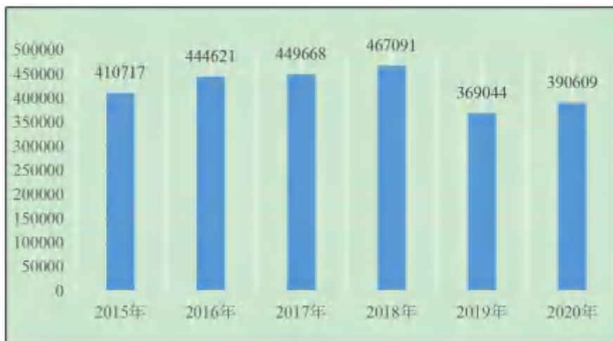
图 1-4 2015-2020 年阳泉市交通运输、仓储和邮政业增加值（万元）