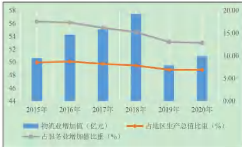
图 1-3 2015-2020 年阳泉市物流业增加值及占比