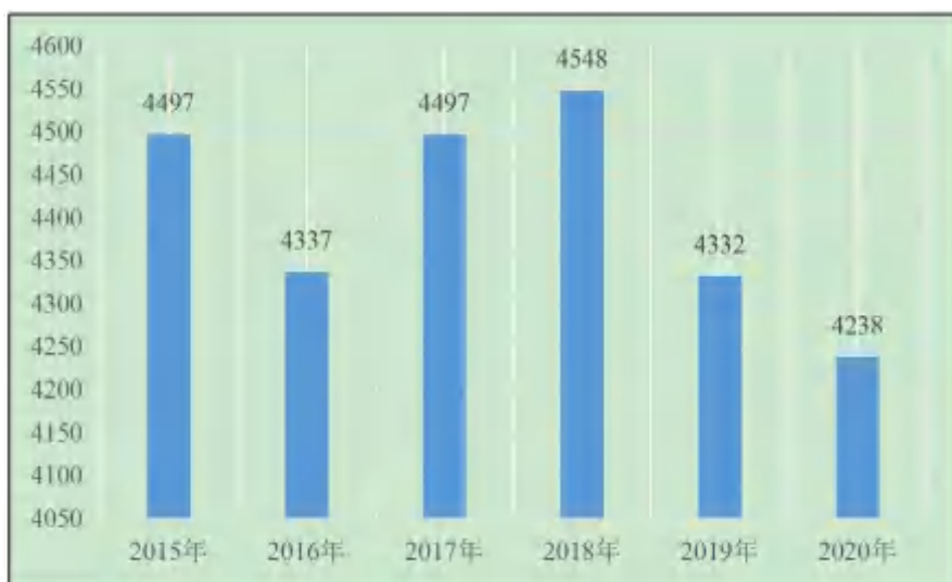
图 1-6 2015-2020 年阳泉市铁路货运量（万吨）

大宗商品物流运输发展平稳。 “十三五”期间，全市煤炭产量约为 5000 万吨/年，耐火产品、氧化铝等年产能接近 2000 万吨，产品外运需求强烈，形成了以煤炭、耐火等大宗原料外运为主的物流格局，铁路货运方式占比高达 50%以上，货物运输经济性和绿色化水平不断提高。2020 年，全年铁路货运量 4238.2 万吨，其中，阳泉站总发运煤炭 3851.2 万吨，阳涉铁路境内 4 个集运站年发运煤炭 387 万吨。此外，华阳新材料科技集团联合中国铁路北京局集团、天津港集团借鉴“内陆港”模式，成功组建山西（阳泉）国际陆港集团有限公司，致力打造高速高效的现代化物流体系，构建连接“一带一路”的大通道，实现“矿、路、港”一体化发展。